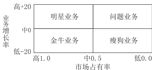
图 1-1 波士顿矩阵

波士顿矩阵如图 1-1 所示。横轴表示 企业业务的市场份额 ，一般用市场占有率表示，反映了企业在市场上的竞争地位。纵轴一般用业务增长率表示，反映了企业经营业务在市场上的相对吸引力。